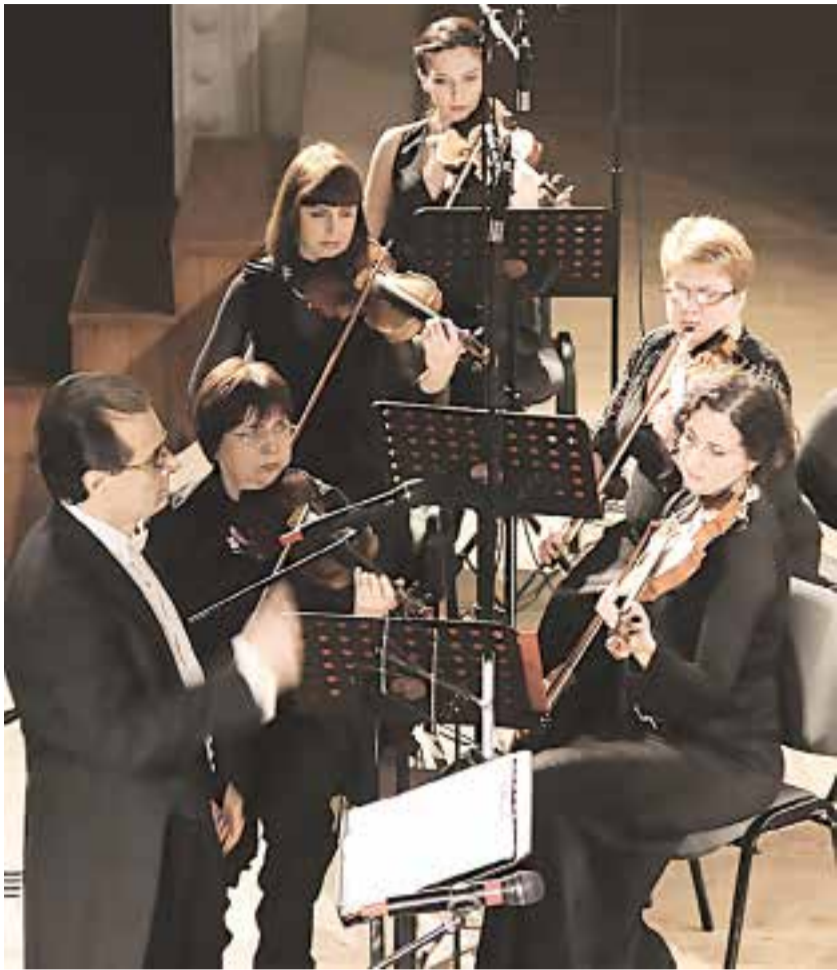
16 марта в Абхазской государственной филармонии в рамках Года Первого Президента Абхазии В. Г. Ардзинба состоялся концерт, посвященный 22-лет-

Джованни Перголези «Stabat Mater – Стояла мать скорбящая» в тринадцати номерах.