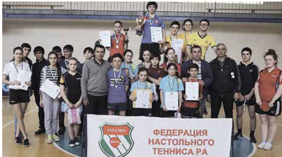
С 29 мая по 1 июня в г. Цхинвал проходил Второй Открытый международный турнир по настольному теннису, посвященный акту признания Независимости Республики Южная Осетия.

В соревнованиях приняли участие 7 команд из Южной Осетии, Абхазии, Дагестана, Северной Осетии, Кабардино-Балкарии, Ставропольского края и Карачаево-Черкессии ( всего 80 спортсменов).