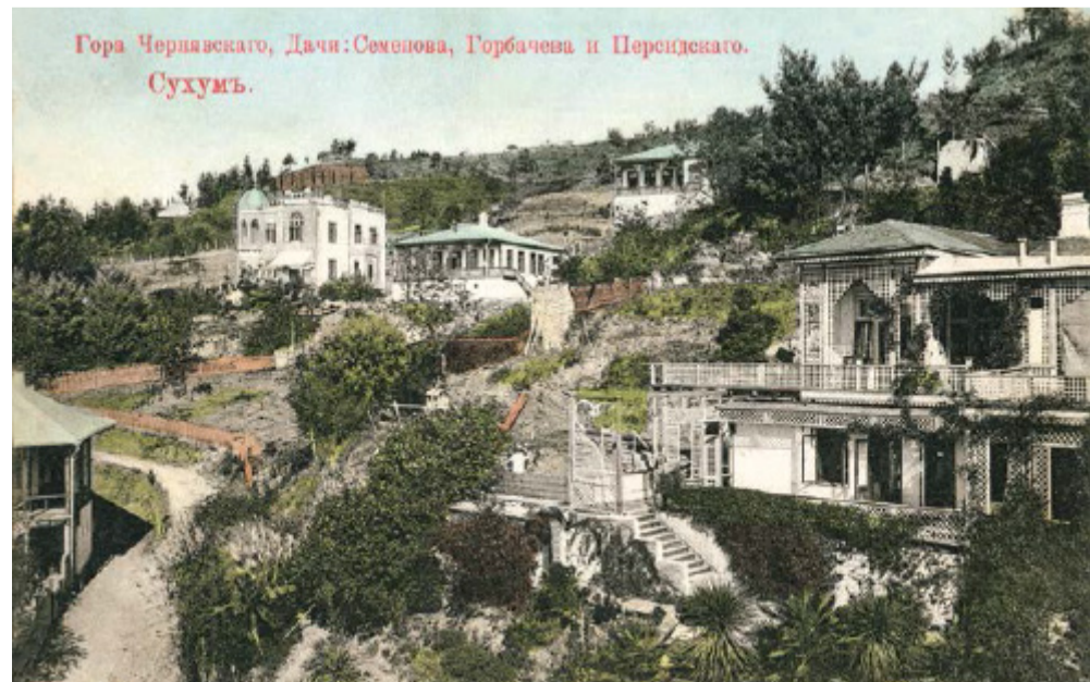
Гора Черныашко, Дачи: Семенов, Горбачева и Парсизенского. Сухумь.

в основном это были турлучные постройки, мазанки (город неоднократно подвергался разрушению и пожарам). Лишь в конце XIX - начале XX вв. появляются здания, представляющие архитектурную ценность. Это, прежде всего, индивидуальные строения. Каждый архитектор хотел привнести свой, неповторимый акцент. Кроме того, многие представители различных национальностей вносили в градостроительство свой этнический элемент. Абхазы строили дома обязательно с длинной открытой верандой, лестницей (односторонней или двусторонней) и резьбой, что придавало городской архитектуре колорит абхазских строений типа «акуаская». Такие же этнические нюансы отмечены в домах других этнических групп - армян, персов, немцев и др. Все это создавало неповторимый колорит