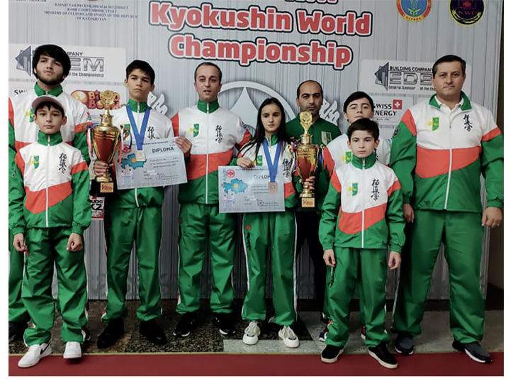
Команда выехала в Казахстан при поддержке Комитета по вопросам молодёжи и спорта Администрации г.Сухум, а также администраций Очамчырского и Гулрыпшского районов, «Универсал Банка» (г.Сухум), ООО «Абхазрегион строй».

Нашу команду представляли бойцы из Сухума, Очамчыры и Гулрыпшского района и поселка Агудзера.