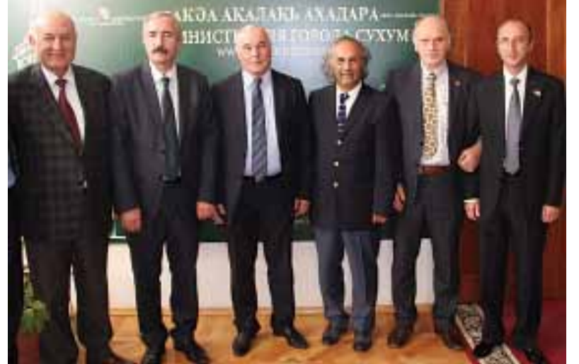
Группа депутатов Собрания Картала, самого большого района Стамбула, посетила Сухум в составе делегации, которая приехала для участия в фестивале «Золотая лань».