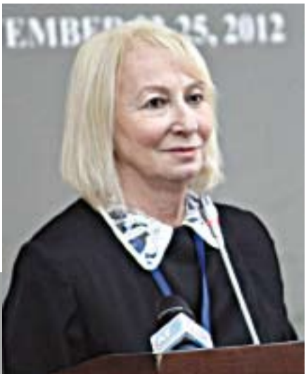
асазьшөаракөа аарцшлатөуп, хажөлөр рхатарнакөа сидкылатөуп, адуней 53 төйла ркны инхо ацсуаа

Асаат 11 рзы Апсны Аихабыра Реилазаара ахьбра азалду акны иаатит Ацсуа-абаза жөлөр VI Адунейзегьтөй Рконгресс. Уи аусура иалахөын