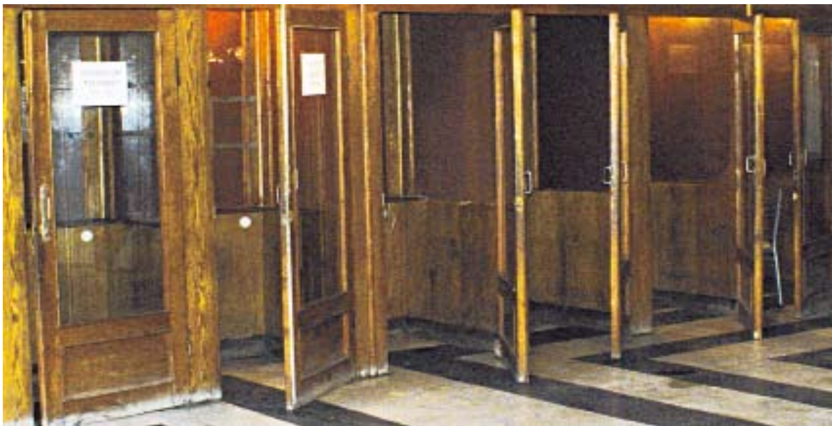
Тарифы ГТС прежние, но абонентов пока не прибавилось!

Справка: Стоимость тарифов на ГТС (городская телефонная станция): РФ – 8 руб.; СНГ – 10; Европа, Азия, Америка, Африка, Австралия все по 18 рублей. А вот что предлагает своим абонентам одна из сотовых компаний: РФ – 19.; СНГ от 20 до 22 руб.; Европа, Азия от 20 до 21 руб.; США-Канада – 40 рублей.