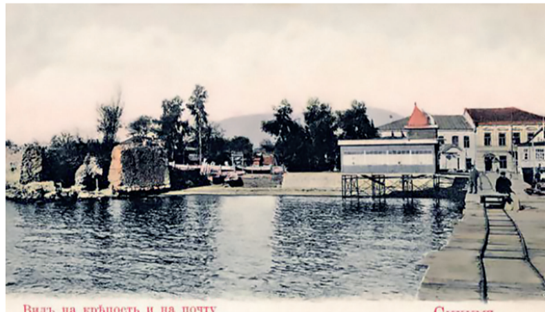
Видь на крѣпость и на почту

В связи с увеличением операций и расширением штатов Сухумская почтово-телеграфная контора с 1 мая 1912 г. была возведена с 4-го класса в 3-й. В «видах расширения помещения и предоставления публике удобств», телеграф