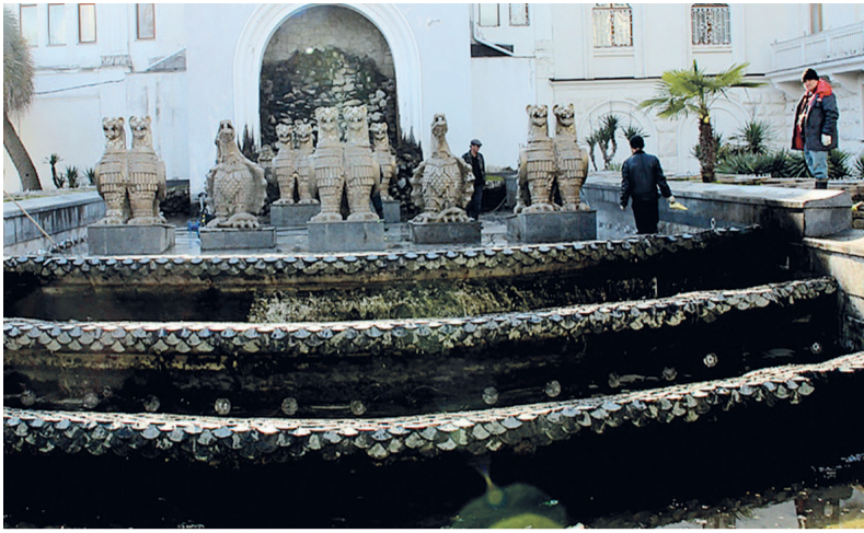
Коммунальное управление администрации г. Сухум проводит работы по очистке и окрашиванию фонтана перед Абхазским драматическим театром в рамках подготовки к курортному сезону. Этот архитектурный комплекс с мифическими грифонами завораживает: по вечерам с наступлением тепла сюда приходит все больше людей.