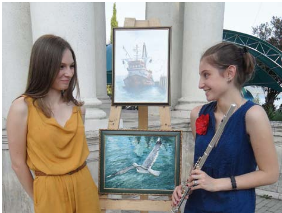
Творческий союз двух талантов создал атмосферу праздника