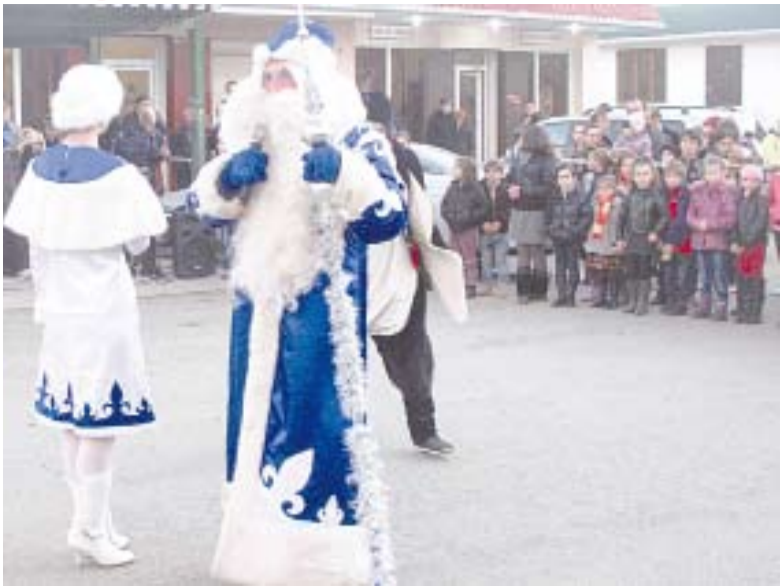
Праздничное новогоднее представление для детей Нового района подготовили актёры Русского драмтеатра.

Программа была интересной и увлекательной. Об этом можно судить по тому, как активно дети хлопали, танцевали вместе с героями сказок: пингином, лешием, бабой Ягой, и, конечно же, Снегурочкой и Дедом Морозом. Представление длилось полтора часа. Самым приятным сюрпризом для детей, были новогодние подарки и фейерверк.