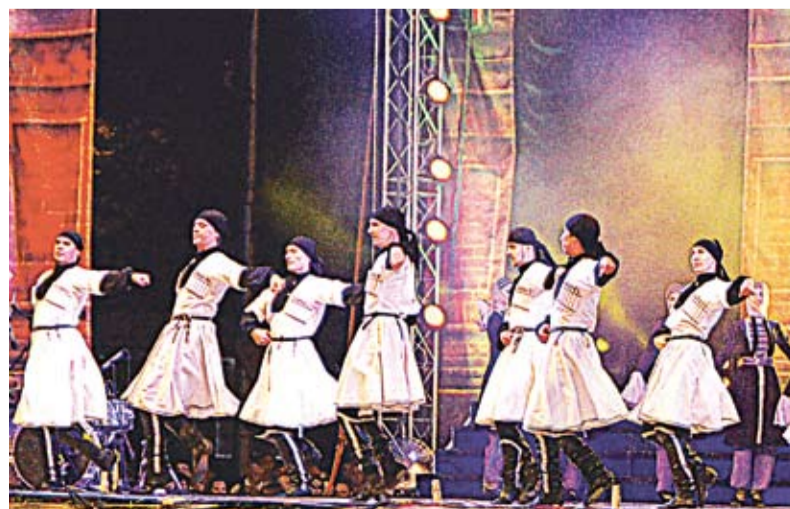
Абхазский народный танец в исполнении молодых краснодарских танцоров вызвал шквал аплодисментов