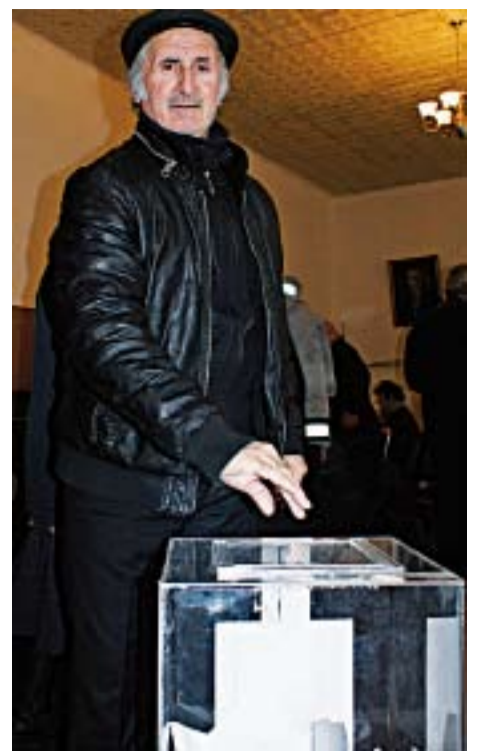
Абхазии гарантом мира и стабильности.

А 26 февраля в 10-й школе прошло досрочное голосование. Оно было организовано для тех, кто не сможет прийти на участки 4 марта. Таких оказалось немало. С 8 до 20 часов жители столицы шли на голосование. Многие, отвечая на вопрос корреспондента нашей газеты говорили, что голосуют за сильную Россию, которая стала для